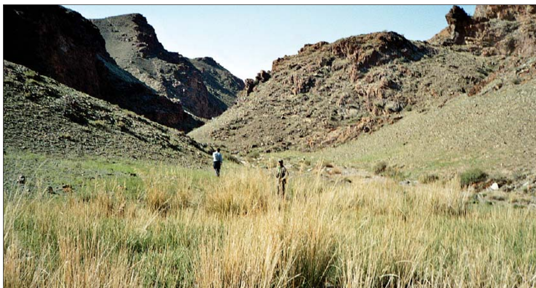
Die Steinböcke liegen sehr hoch in den Hängen. Zum Beobachten und Ansprechen müssen die Jäger über ihnen sein.