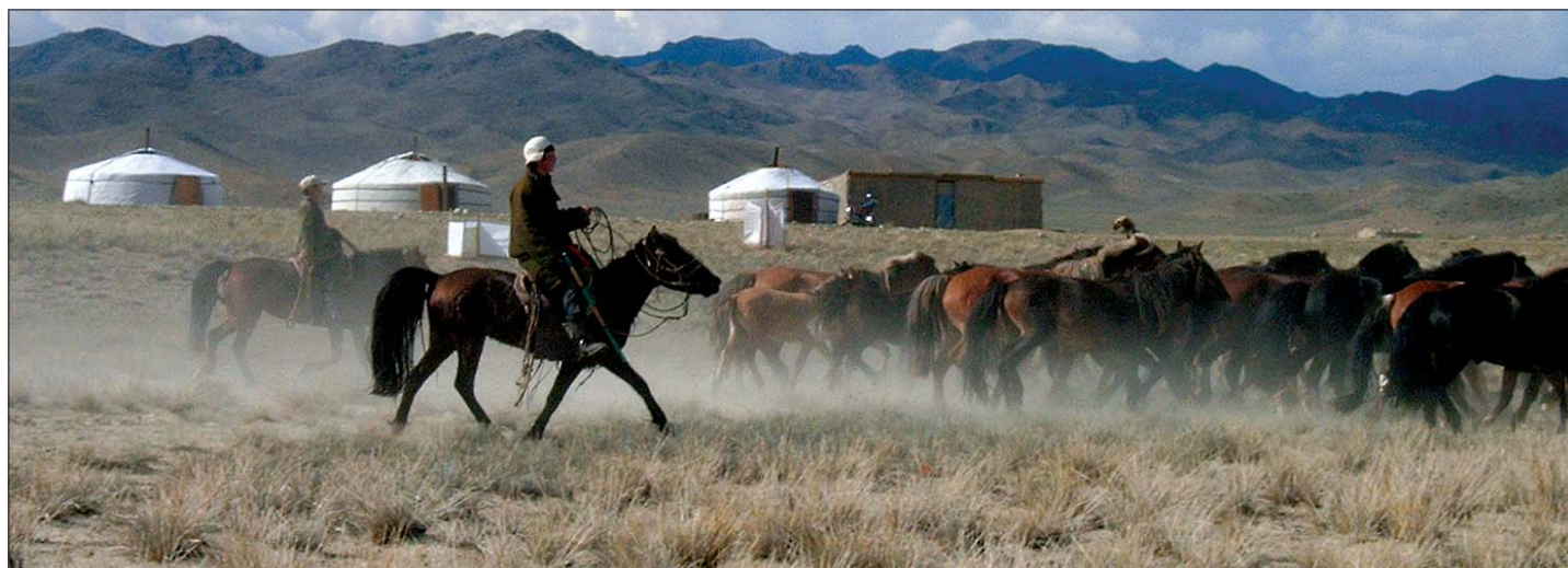
Vorbeiziehende Pferde, riesige Schafherden, Umzugskarawanen mit ihren Herden und Jurten begeistern immer wieder.

Ich dachte der Fahrer wird nun ausruhen und der Dolmetscher macht sich einen ruhigen Tag, denn das Feuerkommando konnte mir auch der Jagdführer durch Zeichen geben, aber nein, großes Aufgebot in die Berge. Alle bewaffnet mit Optik vom Feinsten fürs Museum, und auf ging es in die Höhen des Altai.