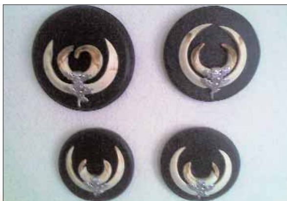
Pakistanische Keilerwaffen - zuhause an der Wand.