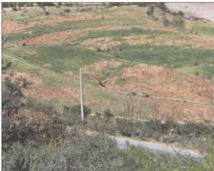
Beträchtlicher Wildschaden in den Weizenfeldern.

Die Saujagd selber ist als Drückjagd organisiert. Die etwa sechs bis zwölf Schützen werden von den ortskundigen Führern an den Wechsellern oder anderen passenden Stellen angestellt. Die Treiberwehr besteht aus 20 bis 30 Einheimischen, auch sind mehrere Hunde dabei.