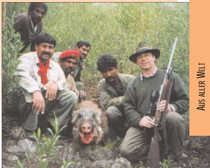
Ein kapitaler Keiler wurde erlegt.