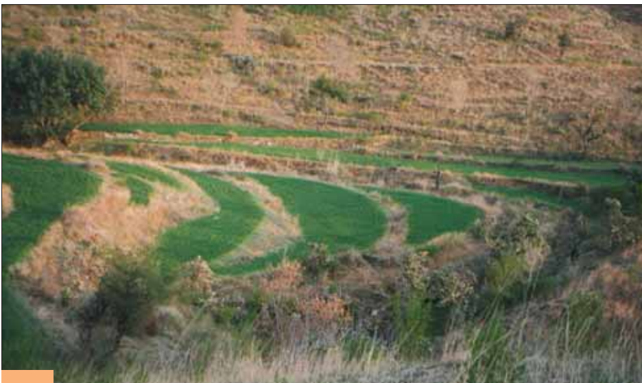
Terassenfelder an den Berghängen.

Weiter oben am Indus liegt der Nanga Parbat, der mit seinen 8.125 Metern zwar nur der neunthöchste Berg der Erde, aber 3.000 Meter höher als alle umliegenden Berge ist. Seine Südwand ragt 7.000 Meter über dem Indus auf - das ist die größte Höhendifferenz der Welt. Der Nanga Parbat ist besonders bei den Bergsteigern bekannt.