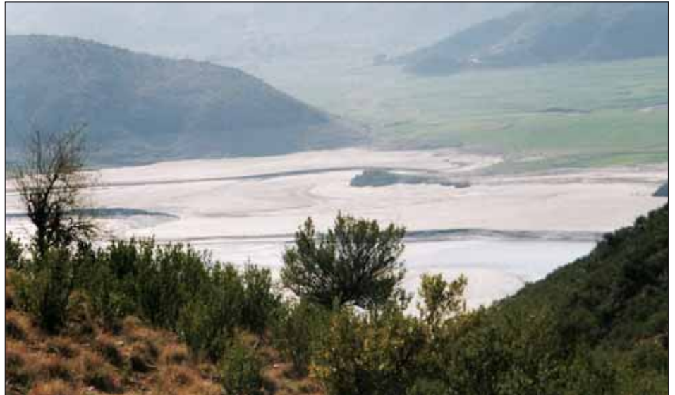
Der Indus mit seinen fruchtbaren Überschwemmungen.

Nördlich von Islamabad, der Landeshauptstadt - hier befindet sich der International Airport - gelangt man auf den Karakorum-Highway. Diese Straße folgt lange dem Oberlauf des Indus immer höher hinauf ins Gebirge. Nachdem die Straße das immer schmalere Indus-Tal verlässt, führt sie durch das Hunza-Tal weiter bis an die chinesische Grenze. Im Hunza-Tal hat man einen Ausblick auf sieben Berge, die höher als 7.000 Meter sind. Der Karakorum-Highway ist ein Teil der uralten Seidenstraße.